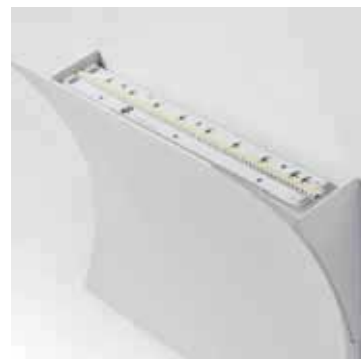
Modulo Led - LED module -Led Modul Módulo LED - Светодиодный модуль

CE T45.10 ALO, T114.10 ALO, T110.10 ALO, T112.10 ALO